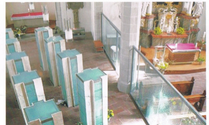
Oben: Das Erdgeschoss des Augustiner-Seminars wird zurzeit umgebaut. Unten: Die Allerheiligen-Kirche in Erfurt wurde nach der Profanierung in eine Begräbnisstätte für Urnen umgewandelt. Auch in der profanen Kirche des Augustiner-Seminars soll ein Kolumbarium entstehen.

Die Anbindung des Augustiner an das Hauptgebäude erfolgt unterirdisch durch einen Versorgungstunnel und durch einen Übergang – die Bismarckstraße wird für Radfahrer und Fußgänger offen bleiben. Auf dem Freigelände werden darüber hinaus ausreichend Parkplätze entstehen.